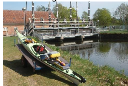
Vi kommer ikke udenom...