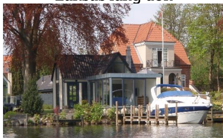
Luksus lang åen