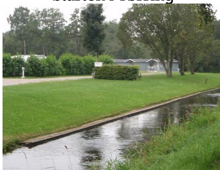
Starten i Tørring